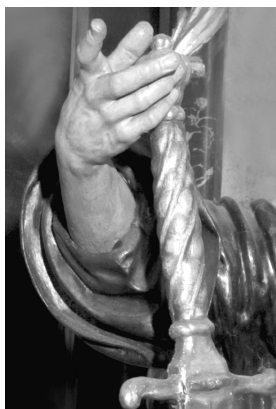
Hl. Paulus, Pfarrkirche Mattighofen, Detail

Dieser arbeitete bis zu seinem Tod in Venedig, wo er für die deutschen Bildhauer eine ähnliche Bedeutung erlangte wie Carl Loth (Carlotto) für die Maler.